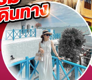
คาเฟ่ใหม่ SON TRA MARINA