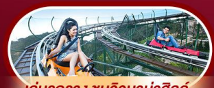
เล่นรถราง ชมวิวบานาฮิลล์