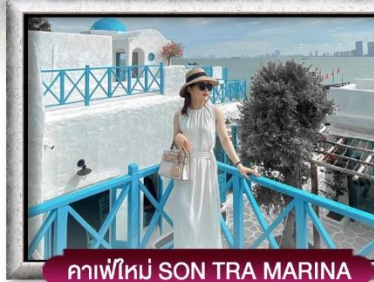
คาเฟ่ใหม่ SON TRA MARINA