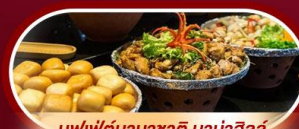
บุฟเฟ่ต์นานาชาติ บานาฮิลล์

พักผ่อน บานาฮิลล์ 1 คืน นั่งกระเช้าที่ยาวที่สุดในโลก ขึ้นสู่บานาฮิลล์ ชมเมือง ฮอยอัน เมืองมรดกโลกที่สวยงามและเจียบสงบ พิเศษ!! บุฟเฟ่ต์นานาชาติ บานาฮิลล์